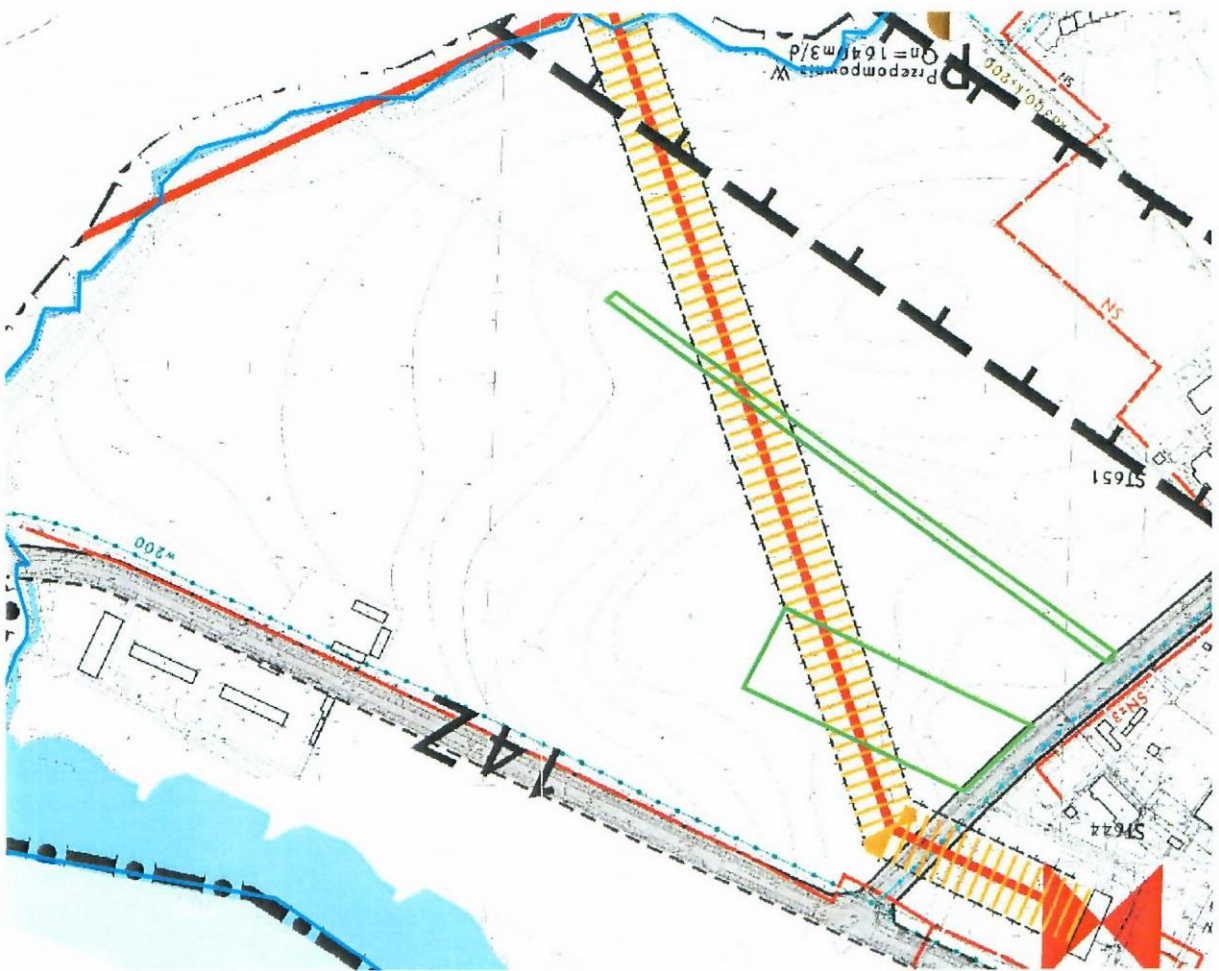
Wzrys z planu – infrastruktura (przebieg linii wysokiego napięcia)

Ponadto, chcąc poinformować, że zgodnie z obowiązującym studium uwarunkowań i kierunków zagospodarowania przestrzennego Gminy Brzeg przedmiotowe działki położone są w granicach terenu oznaczonego symbolem E5 – zespoły cmentarne – wężły ekologiczne systemu SPM o znaczeniu lokalnym – chronione. W tej sytuacji w przypadku podjęcia uchwały o zmianie planu miejscowego dla terenu m.in. przedmiotowych działek mogłyby one otrzymać przypisane przeznaczenie - tereny cmentarzy. Mając na uwadze, że działki będące własnością gminy są niewielkie obszary, pozostałe przyległe tereny będące we władaniu Agencji Nieruchomości Rolnych (obecnie Krajowego Ośrodka Wsparcia Rolnictwa) mogły być przekazane gminie tylko na realizację celów publicznych, to z uwagi na uwarunkowania tego terenu, na etapie sporządzenia studium, uchwalonego w roku 2008, zdecydowano o takim kierunku zagospodarowania tego obszaru..