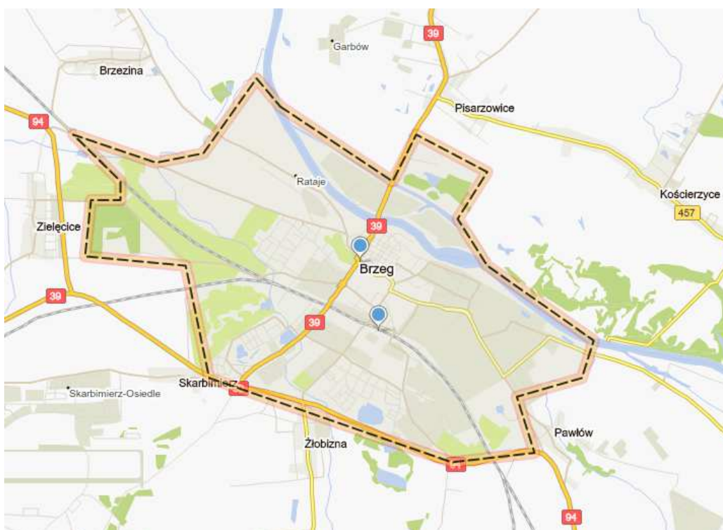
Rys.1. Położenie Gminy Miasto Brzeg na tle układu komunikacyjnego

Sprzyjające położenie geograficzne, warunki przyrodnicze, a przede wszystkim unikatowe w skali kraju bogactwo dziedzictwa kultury materialnej oraz historia regionu stwarzają ogromną szansę na rozwój turystyki w Brzegu i okolicach. Ważnym elementem wpływającym na znaczenie miasta jest jego dostępność komunikacyjna. Składają się na nią: dobrze rozwinięta sieć dróg gminnych w obrębie granic administracyjnych miasta, przebiegająca przez Brzeg droga krajowa, transeuropejska magistrała kolejowa, jak również niedalekie sąsiedztwo autostrady z węzłem w Przylesiu.