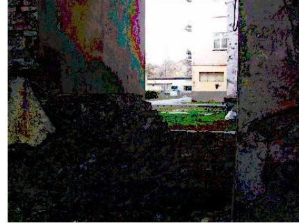
widok od strony podwórka Prastowska 34